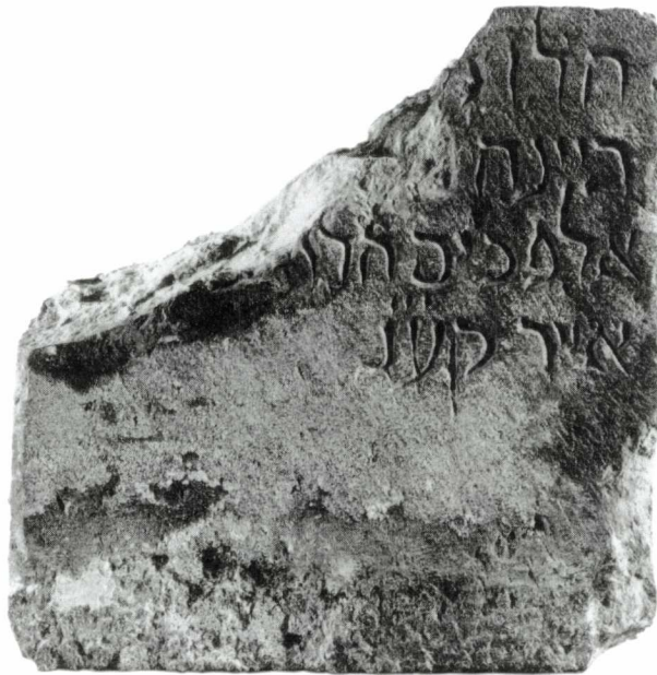
2. Inscripció funerària hebraica de Girona