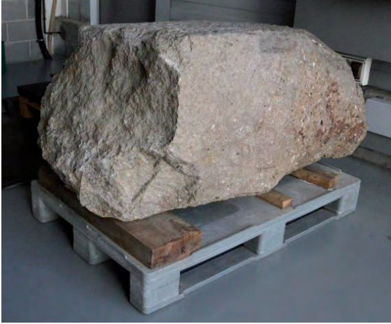
FIGURA 6. Vista general de la làpida, amb l'extrem mutilat.

Es correspon amb la forma 1 de Jordi Casanovas, que és la més freqüent a la necròpolis de Montjuïc: se'n conserven 24 làpides (entre les quals només sis de completes i dotze de datades), que van del segle XI a principis del segle XIV (veg. Casanovas, 2004, p. 215). Com és característic d'aquests grans blocs, el que s'estudia aquí té un aspecte una mica descuidat en la talla de la pedra i en la preparació de la superfície epigràfica.