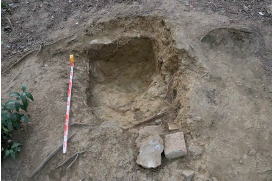
FIGURA 4. Negatiu en el terreny un cop extreta la làpida. S'observa l'estratigrafia existent amb el sediment que conforma el talús, les argiles naturals i l'acumulació dels maons i pedres usats per a la seva extracció frustrada.

amb un rodó corrugat de ferro en una zona molt pròxima, apunten a la seva extracció fallida, possiblement a causa de les seves grans dimensions. Els maons emprats com a base de recolzament per a intentar moure la làpida presentaven la mateixa factura que els maons que basteixen el mur que delimita l'antiga carretera de Montjuïc, situada a la part alta del talús. Per tant, tot sembla indicar que en el moment de la construcció de la via es va voler extreure la làpida.