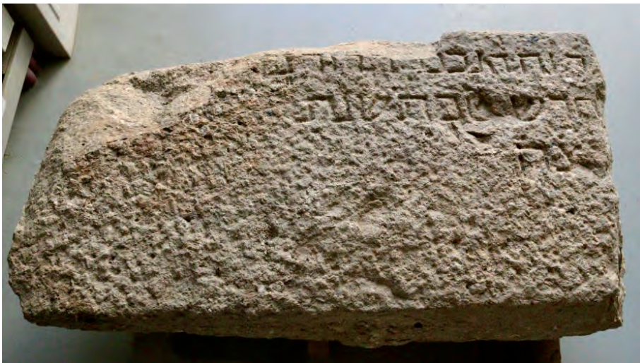
FIGURA 7. Imatge de la cara superior de la làpida amb la inscripció epigràfica.

Es correspon amb la forma 1 de Jordi Casanovas, que és la més freqüent a la necròpolis de Montjuïc: se'n conserven 24 làpides (entre les quals només sis de completes i dotze de datades), que van del segle XI a principis del segle XIV (veg. Casanovas, 2004, p. 215). Com és característic d'aquests grans blocs, el que s'estudia aquí té un aspecte una mica descuidat en la talla de la pedra i en la preparació de la superfície epigràfica.