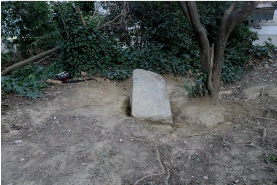
FIGURA 3. Vista de la làpida hebrea en el talús on es va localitzar.

En el moment de ser documentada, la làpida es trobava parcialment a la vista, amb la inscripció de cara amunt, i estava parcialment coberta per la vegetació que s'estenia pel sotabosc de la zona. El fet de no trobar-se en posició oest-est, tal com marcarien els rituals d'enterrament jueus, podria ser un altre element indicatiu que potser no es trobava in situ i, per tant, que possiblement no estava associada a cap tomba.