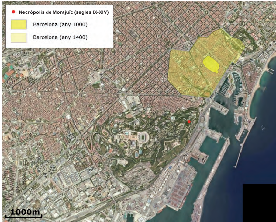
FIGURA 1. Plànol amb la ubicació de la necròpolis de Montjuïc en relació amb la ciutat medieval de Barcelona entre els segles IX i XIV. Font: Institut Cartogràfic i Geològic de Catalunya. Autor del plànol: Xavier Maese.

Les primeres notícies sobre la necròpolis jueva es remunten a l'any 1091, fent referència a unes «certes veteres iudeorum sepultures», i per tant, permeten deduir que l'aljama de Barcelona ja disposava d'un cementiri, com a mínim, des del segle X, ja que a finals del segle XI ja existien sepultures que es consideraven antigues.