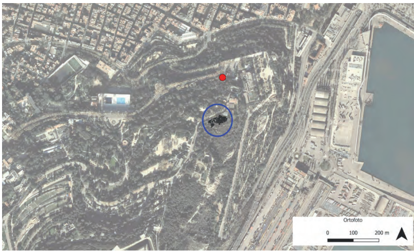
FIGURA 2. Localització de la làpida a tocar de l'avinguda de Miramar, 76 (punt vermell), amb referència a la necròpolis coneguda (cercle blau), campanyes de 1946 i 2001. Font: Institut Cartogràfic i Geològic de Catalunya. Autor del plànol: Emiliano Hinojo.

La troballa fortuïta 3 d'una nova làpida epigrafiada procedent de la necròpolis jueva de Montjuïc en el marge de l'avinguda de Miramar, 76, de Barcelona, va motivar una intervenció arqueològica d'urgència 4 amb l'objectiu de recuperar la làpida i alhora aprofundir en l'estudi d'aquest espai funerari. Els treballs d'aquesta intervenció es van centrar en l'extracció i el trasllat de la peça, l'obertura d'un sondeig del seu entorn més immediat per tal de documentar si la làpida en qüestió es trobava o no in situ , així com el seu estudi posterior. 5