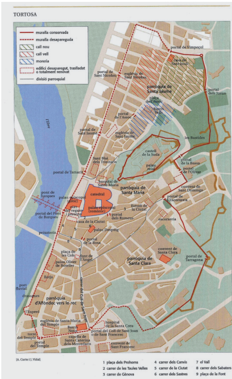
FIGURA 4. Plànol de la ciutat de Tortosa amb les seves muralles (CURTO i VIDAL, «La ciutat de Tortosa», p. 71). El llenç de muralla conservat amb la torre poligonal es troba al sector comprès entre la porta de l'Escorxador i el portal de Tarragona. A la part inferior del plànol, el portal del Temple, on es va localitzar la làpida ara desapareguda.