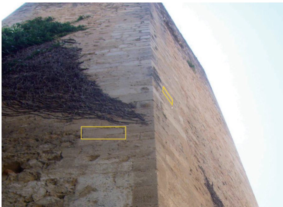
FIGURA 3. Detall de la torre poligonal amb les dues inscripcions conservades en aquest punt de la muralla. A la dreta i més amunt, la nova inscripció.