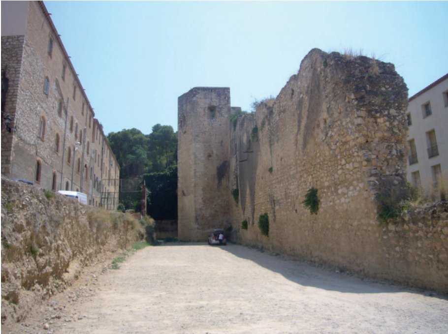
FIGURA 2. Llenç de muralla amb la torre poligonal al fons on es troben les dues inscripcions, al costat de la plaça de Mossèn Sol.