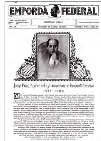
BFC, 11/4/1936, n. 941, p. 1.

Civil i que tan sols duraria dos anys i dos mesos. El darrer número localitzat correspon al 4 de febrer de 1938. Al llarg de la seva trajectòria — divuit anys imprès i vuit anys de silenci forçós que comprenen els canvis polítics i socials que va patir la Catalunya del primer terç de segle—, Empordà Federal es va convertir en un testimoni de primer ordre de la realitat política que es vivia fora de Barcelona i, en alguns moments, en víctima dels fets que transformaven el país.