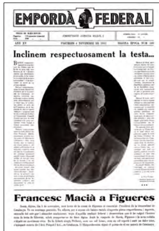
BFC, 4/11/1931, n. 760, p. 1.