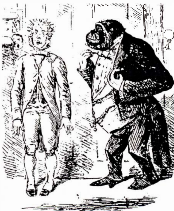
Caricatura sobre la teoria de Darwin publicada a "Illustrated times" (1863).

Els editors tenien raó. Jo no estava en absolut interessat en portar el tema a l'habitual lluita contra ortogènesi o línia d'evolució directa, per dos motius. Primerament, estava d'acord amb Theodosius Dobzhansky que Teilhard, almenys en els seus darrers anys, no era un ortogenetista ortodoxe, sinó que s'havia apropat molt a la clàssica visió darwiniana de la selecció. L'"hasard dirigit" que ell va veure podia haver estat una guia del procés selectiu, podia haver-lo guiat tant interna com externament. D'altra banda, creia