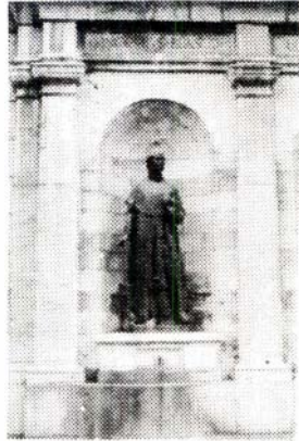
Dos detalls de la façana principal del rectorat de la Universitat de València.