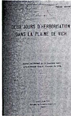
Portada d'un treball de Frère Sennen amb autògraf.

Allí, introduí els seus alumnes en el coneixement de la natura i, pel que podem deduir dels seus treballs, començà -el 1888- a herboritzar de manera metòdica.