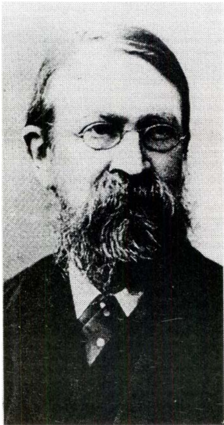
Ernst Mach, físic i filòsof austríac

En resum, hom pot dir que en la realitat natural, l'ànima racional defineix la individuació humana. Això no significa la separació de l'home d'aquella realitat, més aviat el contrari; la definició completa de l'home només es pot fer atenent a tots els ordenaments de la realitat que hi conflueixen.