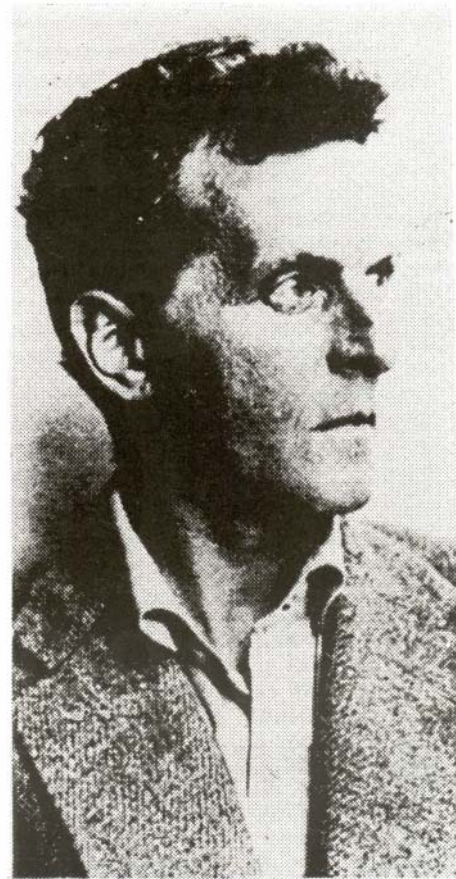
Ludwig Wittgenstein. filòsof austríac.

L'observació científica del nedador pot adoptar una altra perspectiva: la biològica. La Biologia s'interessa per un altre tipus de comportament -o moviment, si es vol- present en l'acció de nedar. En concret, la Fisiologia, centrada en el tema de l'esforç, proporciona un cos de proposicions referides a la creació i alliberament d'energia, la regulació general dels òrgans i sistemes en la situació d'esforç, llur evolució abans, durant i després de la prova, etc.