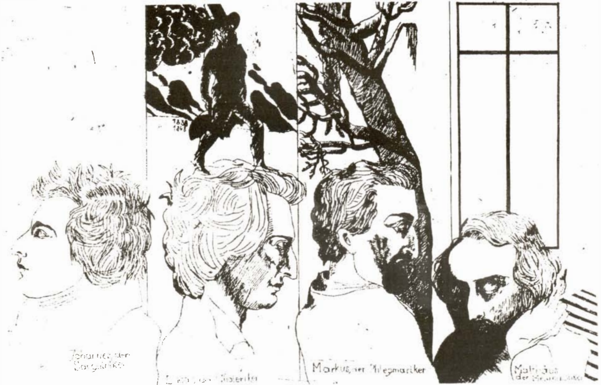
Les quatre edats de l'home, els quatre temperaments i els quatre evangelistes. Retrats de Heinrich Heine.

Biomecànicament, tot i que la persona tingui els braços molt llargs -abastant un diàmetre molt gran en la seva acció, la qual cosa li permet un desplaçament més ràpid-, ningú no diu que aquell fet sigui una qualitat de l'individu que existeix darrera del procés biomecànic; és una variable participant en el procés. Tampoc, a la fisiologia,