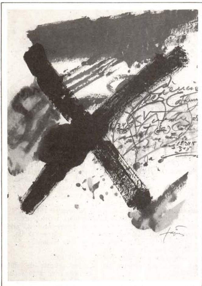
REPRODUCCIÓ DE L'ORIGINAL CREAT EXPRESSAMENT PER ANTONI TÀPIES PER A LA REVISTA "CIÈNCIA"

En aquest sentit, voldríem, per tant, manifestar que (ciència) és plenament conscient que s'ha de fer encara moltíssima feina per poder fer realitat la revista que sens dubte tots volem i desitgem.