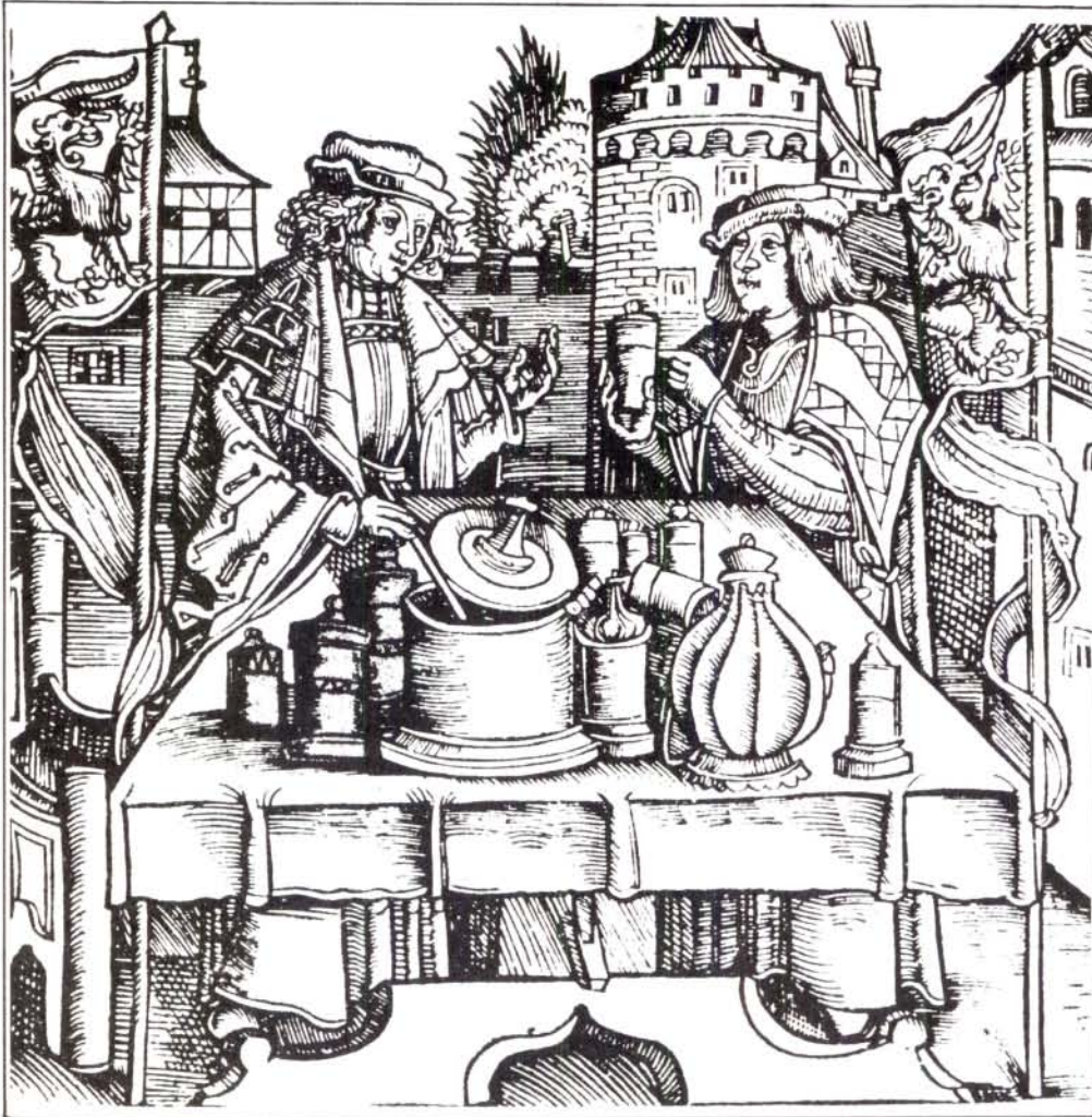
Preparació de la triaca.

Portadella del discurs sobre farmacopea del Principat de Catalunya, de Josep Antoni Savall i Valldejuli (Barcelona, 1788).