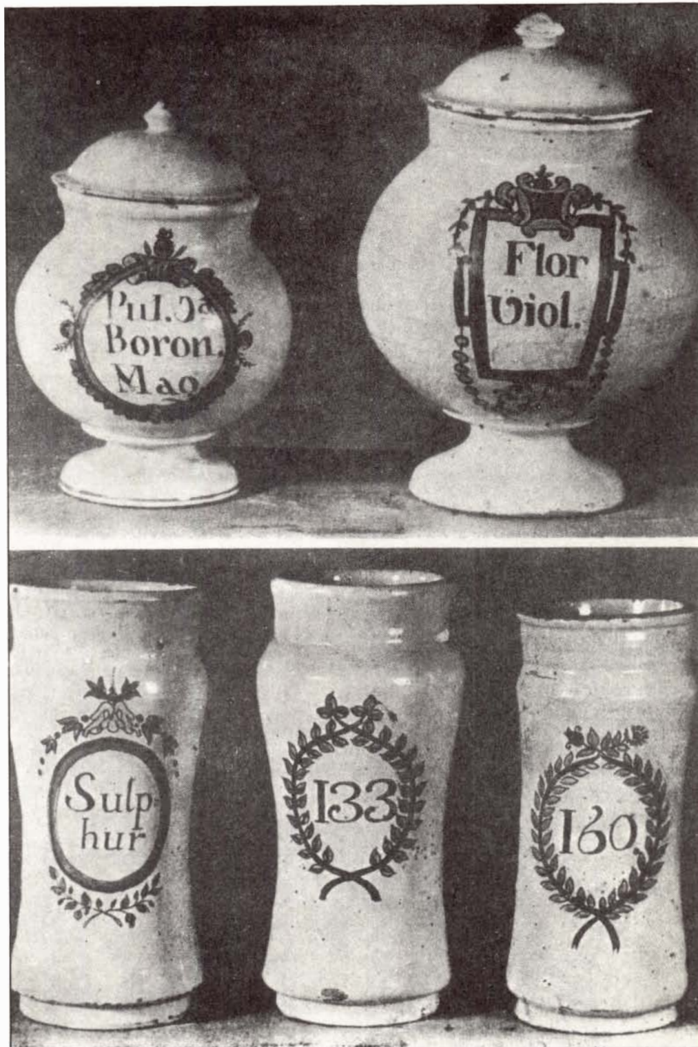
Ampolles i pots d'apotecari catalans del segle XIX.

També impartí lliçons públiques de farmàcia. Acabada la guerra, l'any 1815, confirmat per la Junta Superior Gubernativa de la facultat de farmàcia i amb la conformitat de S.M., l'any 1805 és proposat per a catedràtic tercer del Reial Col·legi de Farmàcia Sant Victorià, de Barcelona. Explica la seva càtedra normalment, fins l'any 1822, amb motiu d'organitzar-se l'Escola Especial de la Ciència de Guarir, la direcció general d'estudis el jubila amb tot el sou, ja que tenia 70 anys. L'any següent, en restablir-se la segona etapa del Reial Col·legi de Farmàcia Sant Victorià, és nomenat cap d'aquesta institució i s'encarregà, com sempre havia fet, de l'ensenyament de matèria farmacèutica fins a l'any 1830. Fruit d'aquesta experiència va ser la realització d'un tractat de matèria farmacèutica en 4 volums amb un total de 1.610 pàgines, no localitzat fins ara i que es