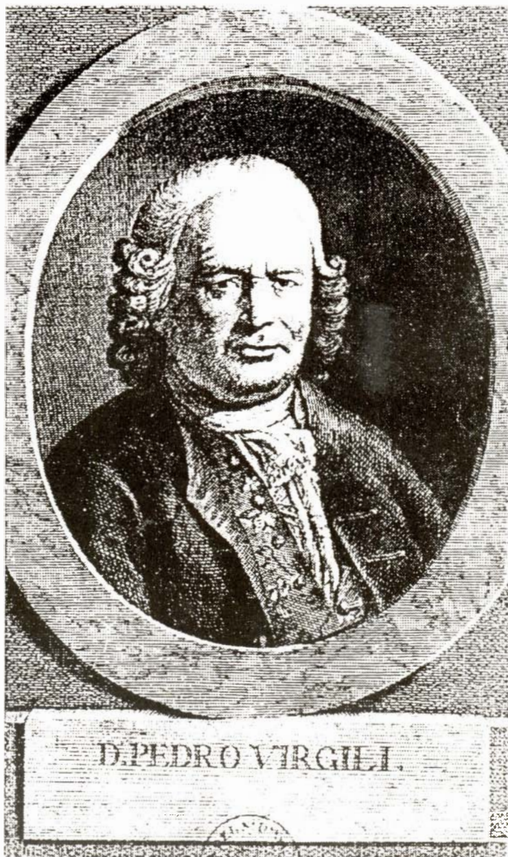
Gravat de Pere Virgili fet per F. Tramullas.