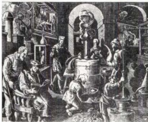
Pròleg: Miquel de Garganta.