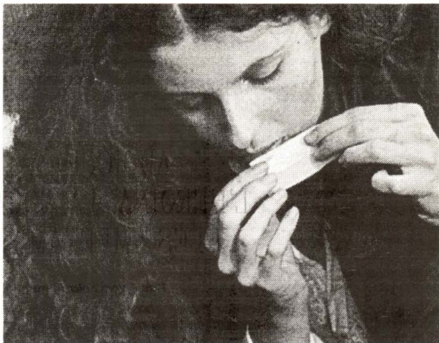
La ingestió de diferents drogues, com per exemple l'haixix, és a l'ordre del dia

És l'únic centre autoritzat a dispensar metadona per a programes de manteniment o supressió ambu-