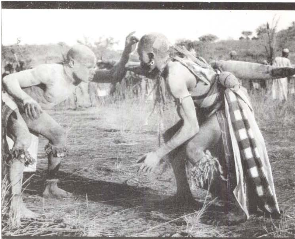
La civilització occidental ha negligit el respecte vers altres civilitzacions que històricament han estat considerades com "salvates".

ha "una història" de la civilització, que no som darrera d'"un passat, ni d'un futur únics"; existeixen moltes cultures, que poden existir si cadascuna té una relació de pau i compatibilitat, lluny del totalitarisme.