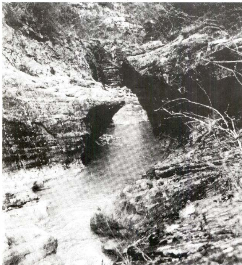
Barranc del Bosc.