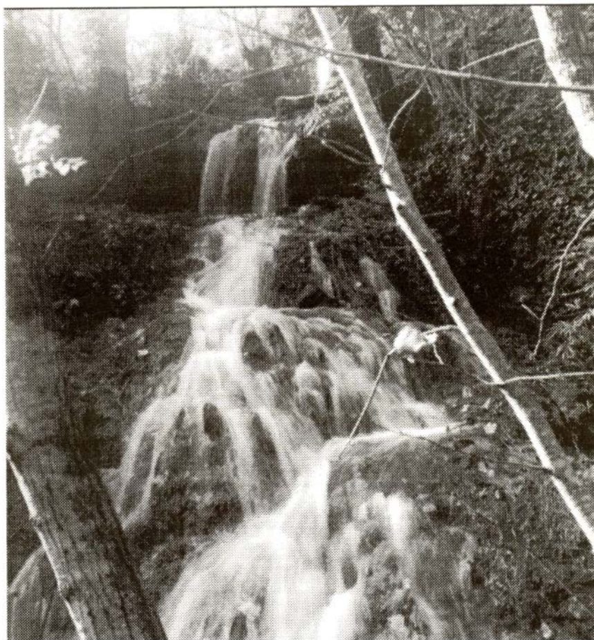
Font Grossa, a Alçamora

Observant el relleu d'aquestes contrades hom observa que els rius principals tallen perpendicularment totes les serralades prepirinenques. L'explicació d'aquest fet força curiós és la següent: el relleu format per l'encavalcament dels mantells fou fossilitzat pels sediments oligocènics; com aquests materials són tous, els rius pirinencs van marcar el seu curs amb gran rapidesa; en topa les aigües amb els materials durs de l'Era Secundària, no varen tenir cap més remei que foradar les grans masses de calcària, formant així els imponents congosts; finalment, l'Oligocèn fou erosionat, creant-se el relleu actual.