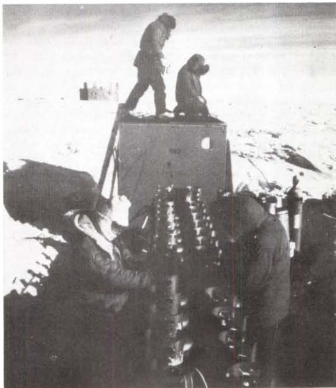
Instal·lació dels motors de propà al laboratori automàtic.