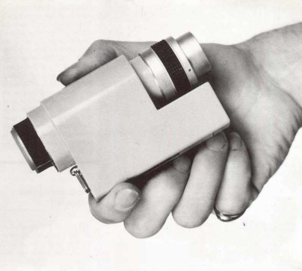
Aparell monocular de visió nocturna pensat per als malalts de retinitis pigmentosa i que ara serà utilitzat en l'estudi del linx ibèric.

Les lents monoculars per a la visió nocturna són fabricades per ITT Electro-Optical Products Division, amb seu als Estats Units, i consisteixen en un tub al buit que intensifica la imatge. El tub recull l'escassa quantitat de llum emesa pels estels o la lluna i converteix la imatge reflectida per aquesta mínima llum en una altra formada per electrons. Després multiplica aquest electrons mils de vegades i per últim converteix la imatge en una exposició brillant, per un procediment similar al de la