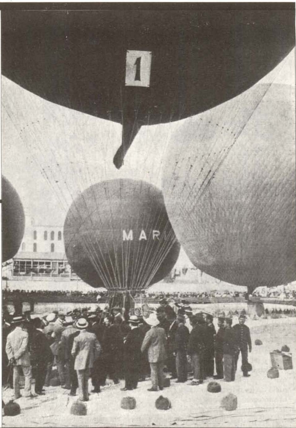
Fig. 4 Fotografia de l'acte organitzat per la secció fotogràfica de la Reial Societat Colombofílica de Catalunya, l'any 1904.

petites notes curtes enviades a la redacció i el "Consultorio del Dr. Bromuro" des d'on es contestaven els diferents problemes fotogràfics dels afeccionats. La revista, per ésser més amena estava il·lustrada amb diverses fotos i fototípies, a colors en els darrers anys, algunes d'elles a hores d'ara prou curioses i nostàlgiques d'altres temps més tranquils, obra d'amateurs nacionals o estrangers. S'hi adjuntaven periòdicament els catàlegs anuals de les cases comercials, participacions a concursos; "La Fotografía Práctica" de tant en tant n'organitzava un entre els seus subscriptors, o bé hi havia suplementos artístics publicats a banda, complementaris de la revista.