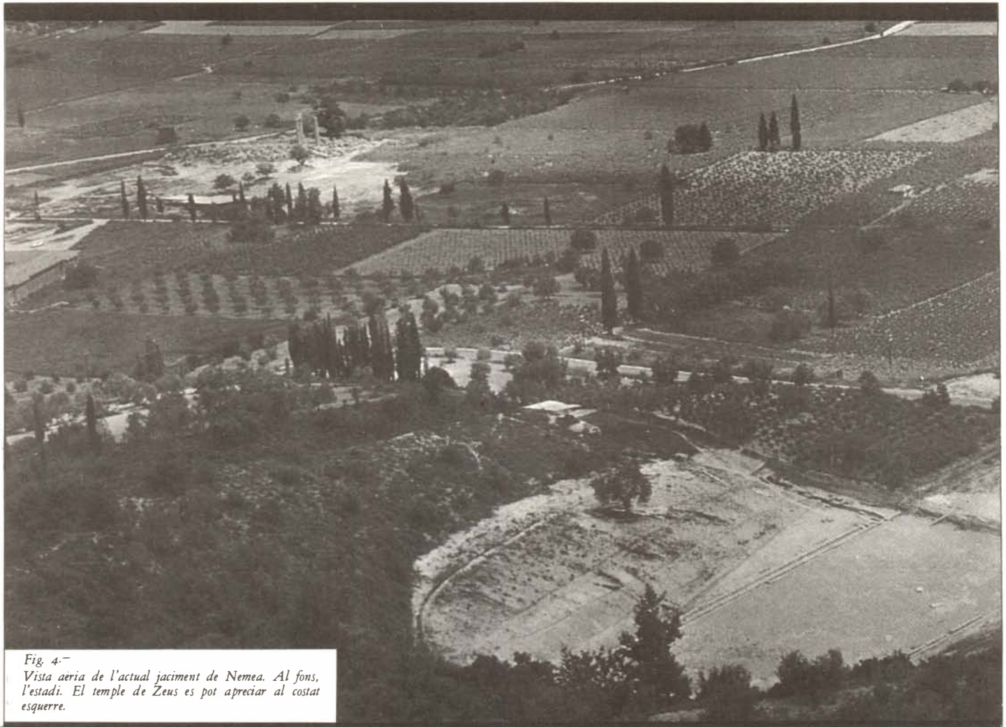
Fig. 4.- Vista aèria de l'actual jaciment de Nemea. Al fons, l'estadi. El temple de Zeus es pot apreciar al costat esquerre.

d'animadors a l'estadi, i en arribar a casa, els triomfadors eren aclamats d'animadors a l'estadi, i en arribar a casa, els triomfadors eren aclamats per una llarga desfilada de gent.