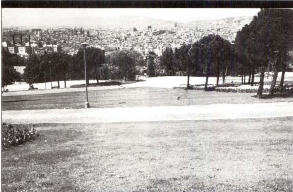
La moderna creació d'espais oberts a ple sol, amb grans catifes de gespa, sense ombra, segueix la moda i l'estil paisatgístic de països centreeuropeus, sense cap respecte a l'ambient mediterrani —natural— de la ciutat.

tica de Barcelona els últims 50 anys —que per la seva extensió passarem ara senzillament per alt— quintuplicaria sens dubte l'espai que fins aquí hem dedicat a quasi 20 segles d'història. Nombrosos jardins de nova planta en el nucli urbà i extenses finques adquirides dins del terme de l'àrea metropolitana, amb gran riquesa de vegetació natural —regenerada amb el temps— vingut a incrementar notablement el patrimoni verd de la ciutat.