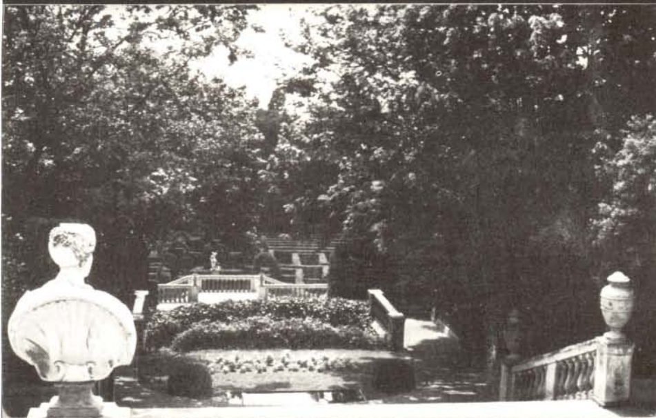
La moderna recuperació de jardins particulars —en la fotografia el Laberint d'Horta— o la creació de nous espais verds dins el casc urbà ha representat —o representa— un ale optimitista d'apropament de la ciutat a la natura.

de extraordinària extensió. Barcelona carece de paseos dispuestos de modo que ofrezcan grata sombra en los días calurosos..." A excepció d'alguns passeigs, plantats com hem vist amb una doble filera d'arbres, tots els altres jardins havien desaparegut completament.