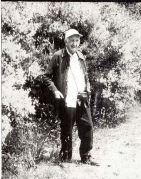
El geògraf català Pau Vila (Sabadell 1881-Barcelona 1980)

dels Orbs –després de l'Angel– a la ciutat. Les primeres fonts públiques foren les de Sant Just i la de la plaça de Santa Anna. I a mesura que les captacions augmentaven, se'n construïren d'altres. Hi hagué aigua per a la casa del Consell, per a alguns casalicis senyorials i per a certs ordes religiosos. El Capítol catedralici n'obtingué a canvi d'un tros de l'hort que tenia fora del portal de la vella muralla romana; i s'hi obrí la plaça Nova, encara en el segle XIV. La Diputació del General tenia mina pròpia. De tota la xarxa i serveis, Socias, el "Mestre de les Fonts", en deixà, l'any 1650, una guia manuscrita perquè els qui el succeïssin se'n poguessin valdre.