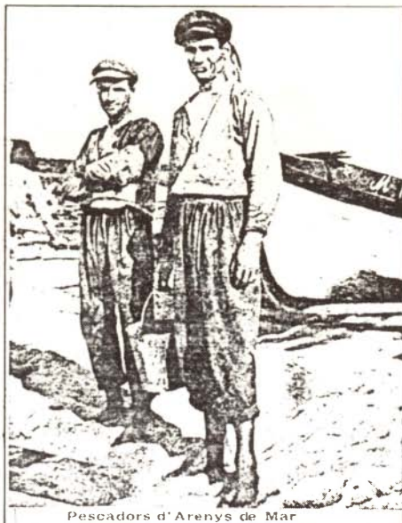
Pescadors d'Arenys de Mar

L'Arxiu d'Etnografia i Folklore de Catalunya (1915) va bastir un veritable projecte d'etnografia de la societat pre-industrial catalana.