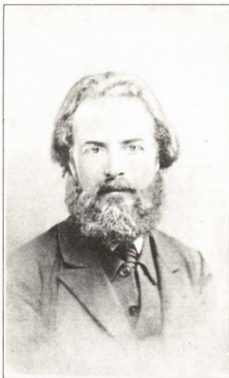
Eliseu Reclus (1830-1905)

Els treballs de Reclus —obra personal ciclòpia i sovint genial— no estan exempts d'errors i