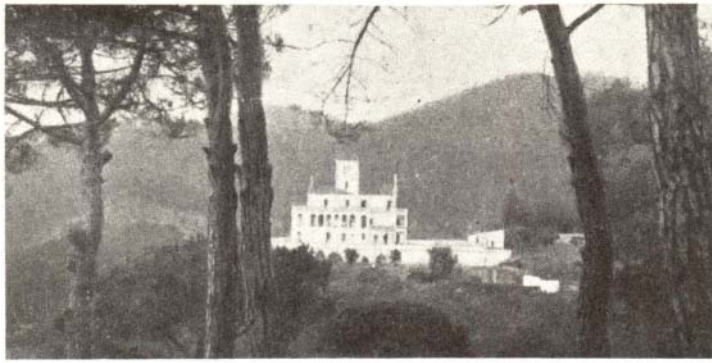
Vista de Vila Joana (1922)

El modelatge d'aquests programes té un llarg recorregut. Fins que no arriba a la tasca quotidiana, passa pel laboratori d'estudis i d'investigacions, que fa estudis d'antropologia, psicologia i pedagogia especial; tracta individualment l'alumne, en col·laboració amb els mestres, sota l'aspecte clínic, psicològic i social per a preparar adequadament la tasca pedagògica encomanada al personal de les escoles. Així doncs, el la-