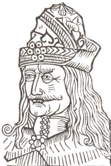
Vlad Tepes, Dracula, segons un incurable