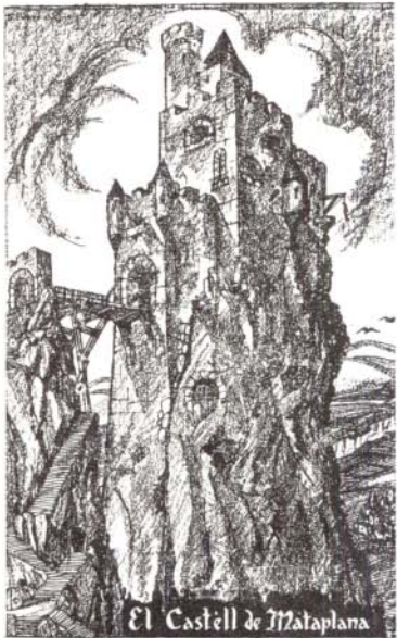
El castell de Mataplana (segons Joan d'Ivori, 1924).

tot un seguit de figures llegendàries i tradicionals que ben aviat es convertiren en motiu d'inspiració de novel·listes, autors teatrals, poetes i folkloristes.