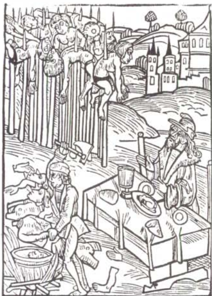
Gravat alemany del segle XV que mostra els empalaments de Dracula.

pels nombrosíssims pares i marits burlats, car havia jagut amb totes les dones dels seus dominis: fadrines, casades i vídues. De la seva esposa legítima, que la veu del poble fa germana de sant Ou, en féu també una santa forçada, car havia de suportar, ultra les contínues infidelitats, un tracte duríssim i de menyspreu. En una ocasió i, segons es descriu en una altra versió, estimbà cingles avall una noble dama quan aquesta, després d'ésser seduïda, li demanà que es casés amb ella. Amb tot, la contalla més famosa refereix els seus amors sacrílegs amb les monges i principalment amb l'abadessa de Sant Joan de les Abadesses, amb la qual mantingué un apassionat idil·li. Segons altres variants de la llegenda, el de Mataplana tampoc no s'espantava davant la necrofilia, i així, no havent pogut posseir en vida una monja jove, ho féu quan ja era morta.