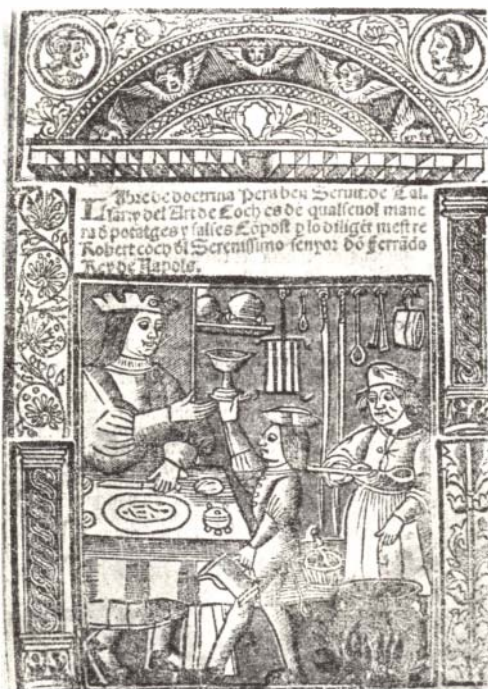
Reproducció de la portada del Llibre del Coch (Barcelona, 1520).

Perquè efectivament el Llibre del Coch és un llibre de cuina cortesana renaixentista. El seu autor, anomenat Mestre Robert o Robert de Nola, era cuiner de la cort de Ferran I de Nàpols, fill natural d'Alfons el Magnànim i hereu d'aquest en el tron napolità de 1458 a