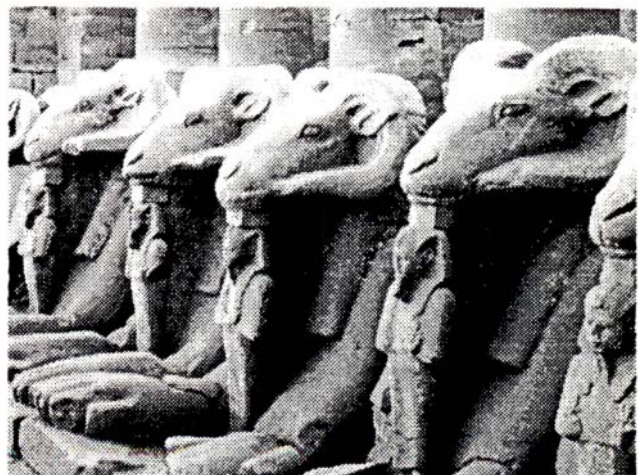
Dromos en forma de moltó que flanquegen una de les entrades al temple de Karnak.