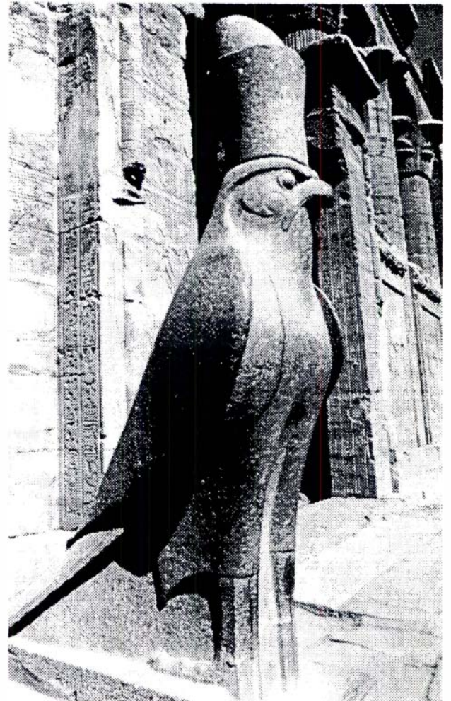
Horus, el déu falcó, fill d'Isis i Osiris; estàtua de granit negre al pati del temple de Edfú, temple construït en honor seu per Ptolomeu Evergetes I l'any 237 a. C.