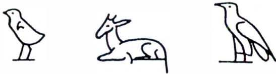
El pollet representa una 'u'; un antílop recent nascut, el so 'iu' i el voltor la 'a'.

Els jeroglífics es poden escriure de dreta a esquerra, d'esquerra a dreta, o en columna, de dalt a baix. Una regla per a interpretar-los és mirar els éssers humans o animals que hi siguin representats, i llegir en la direcció contrària a la qual estan encarats.