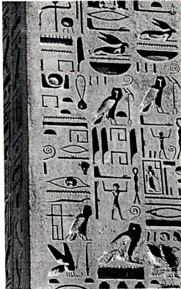
Relleus representant fonemes a l'obelisc del temple de Luxor.