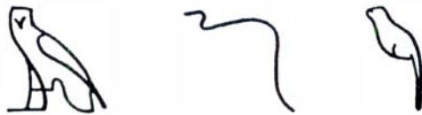
Una òliba representa el so 'm'; una serp representa 'dj', i en un altre sentit, un cap-gros representa el número 100.000.

Els jeroglífics es poden escriure de dreta a esquerra, d'esquerra a dreta, o en columna, de dalt a baix. Una regla per a interpretar-los és mirar els éssers humans o animals que hi siguin representats, i llegir en la direcció contrària a la qual estan encarats.