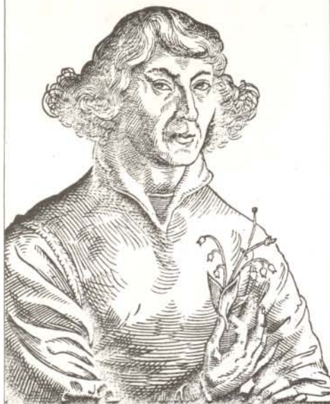
fig. 1 Nicolau Copernic (1473-1543)