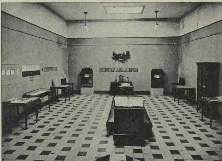
Dos aspectes de l'Exposició de manuscrits, biblioteca i aparells de Física i Química d'Antoni MARTÍ, organitzada a l'Ateneu de Tarragona