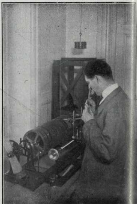
Fig. 2 Petit registrador per a la inscripció de sons

a la reproducció dels sons musicals, sinó també a la impressió i emissió amb fins lingüístics i científics. El perfeccionament que representa el gramòfon, assolit fa totjust cinquanta anys, fressà extraordinàriament el camí per a aquestes aplicacions i avui la fonografia no sols és adaptable a les reproduccions musicals, sinó que ha envaït, mitjançant aparells perfeccionats, l'escola com a instrument per a l'ensenyança dels idiomes i els gabinets lingüístics per als estudis filològics, folk-lòrics i artístics. Una aplicació d'aquest