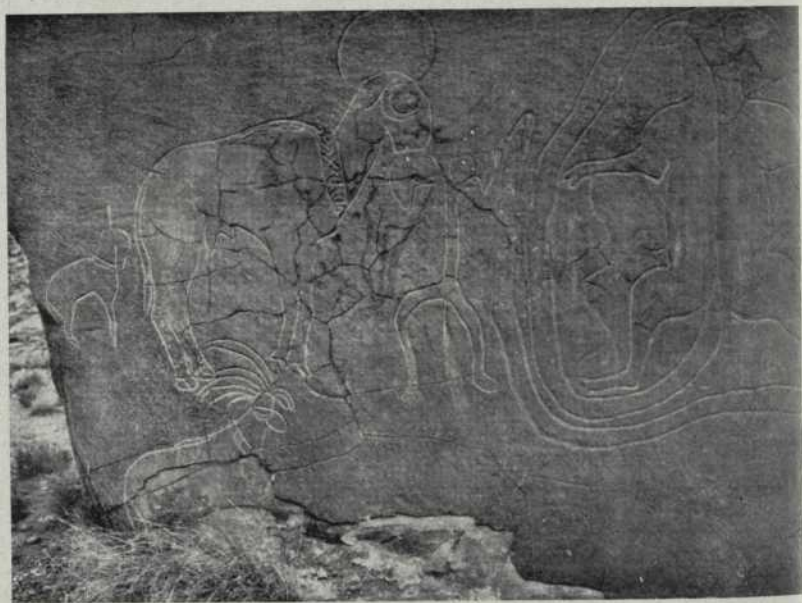
Fig. 1 Figures naturalistes del Djebel Bes Seba (Sahara argelí)

tic africà, per estudiar la paleontologia i l'arqueologia de l'Àfrica Menor, amb les seves cultures del paleolític inferior, les quals, a la fi del achelià, semblen començar un desenrotllament extraordinari—que s'avença de molt, en alguns casos, a les paral·leles d'Europa—amb la producció de les varietats que al musterià penetren fins a la península ibèrica, on el Sr. PÉREZ DE BARRADAS les troba als voltants de Madrid: l'esbaikià, l'aterià i el pre-capsià. Segueix l'estudi del capsità que avui s'extén fins a Egipte (el sebi-lià) i Palestina i que els darrers treballs de Mr. REYGASSE permeten seguir a Tunis (Abd-el-Adhim) fins a les etapes finals de tipus tardenoià, essent curiós que l'àrea de la cultura capsiana africana no sembla pas tocada per