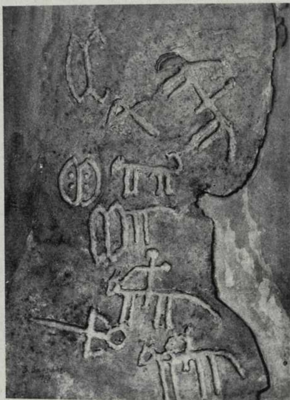
Fig. 3 Figures esquemàtiques de la vall del Dermel (Sahara argeli)

complet, trobant-se també, encara que en menys proporció que liurs restes fòssils, la girafa, el cèrvol, el senglar i la cabra selvatge, tot el què fa pensar en una fauna en certa manera quaternària, però ja en el període en què començava a estingir-se. A més, la regió d'aquest art no és del tot la del desert, sinó la immediata a ell, que durant bastant temps dels períodes següents al quaternari degué ésser habitable.