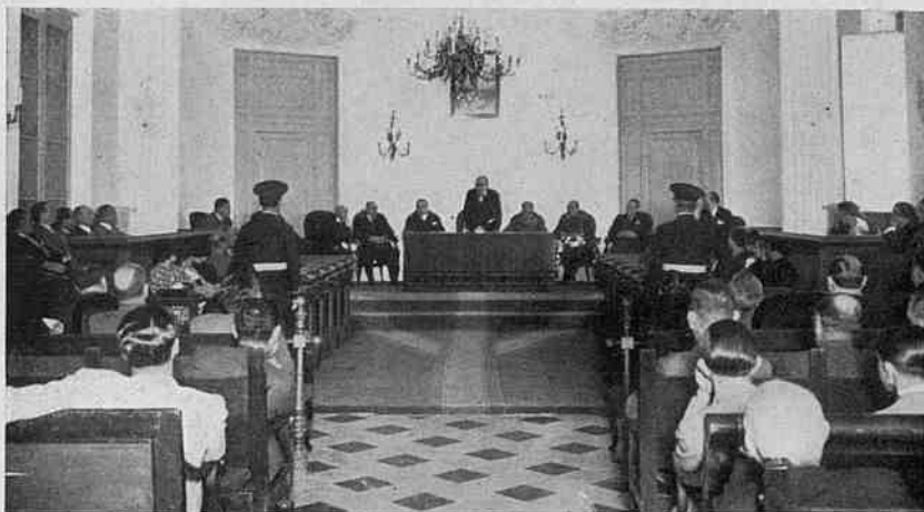
Solemne sessió inugural de la II Assemblea d'Odontòlegs de Llengua Catalana.

Compleixo gustós la missió gratíssima a què em porten els deures del càrrec que en aquest moment ocupo de saludar tots els assembleistes, els quals, ansiosos de renovar els nostres confraternals senti-