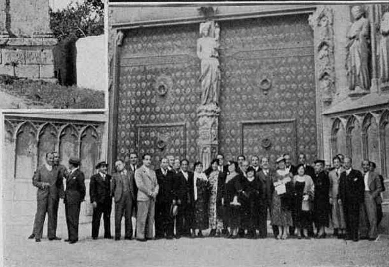
Grup d'assembleistes durant la visita arqueològica.