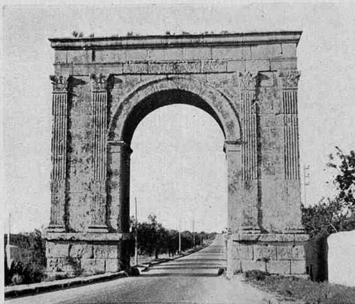
Camí de Tarragona. - L'Arc de Barà.