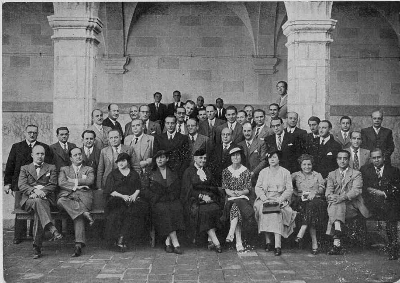
Grup d'assistents a la II Assemblea d'Odontòlegs de Llengua Catalana.