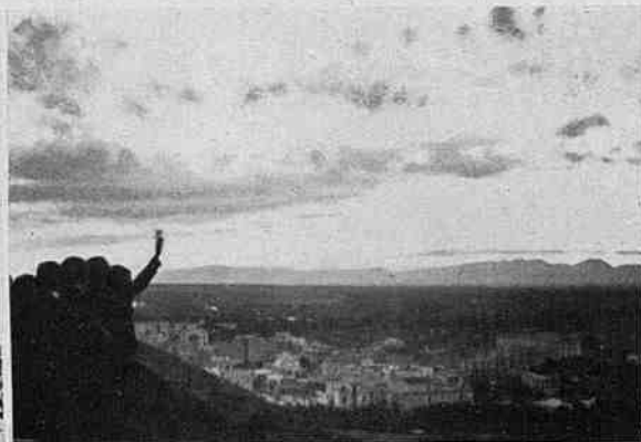
Capvespre tarragoní des de la Torre de l'Arquebisbe.