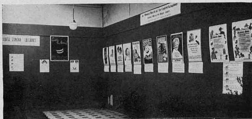
Una vista del Saló de l'Ateneu on s'instal·là l'exposició de Profilaxi bucodental.

Hi figurava una completa demostració gràfica dels serveis d'assis-