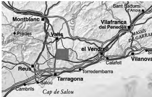
Figura 1. Espai aproximat que pertanyia a l'antic territorium de Tàrraco, amb la situació de l'àrea estudiada (Dalmau 2013).