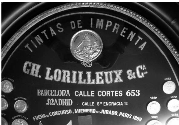
Foto 2. Detall de l'encapçalament estampat en lletres daurades al fons del medaller.

Guary, mentre Pierre no arribés a complir trenta anys, edat que se li requeria per a poder dirigir l'empresa. 5