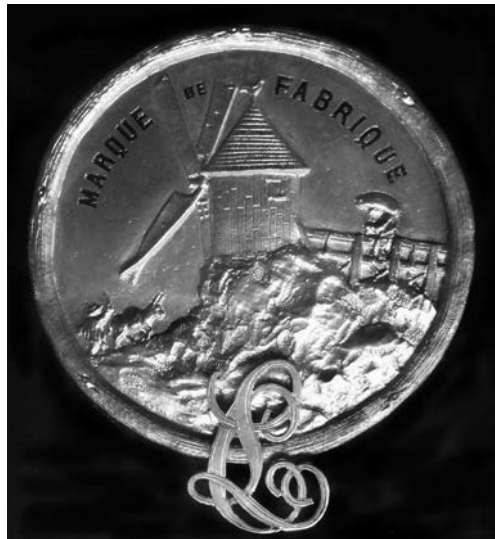
Foto 3. La marca amb el molí de Chantecoq, emblema de la fàbrica de tintes.

Les medalles queden protegides per un vidre i a la part superior, i centrada, hi ha la inscripció Tintas de imprenta i Ch. Lorilleux & C a envoltant la marca de la casa en forma de medalla: un molí de mòlta amb quatre pales situat dalt d'un roquer, amb un portador amb un ase al costat esquerre i un traginer amb un sac al dret. Aquest emblema porta escrit, a la part superior i centrada, Mar-