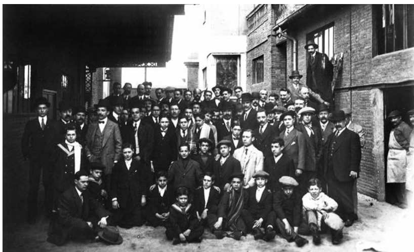
Foto 6. Els congressistes del Primer Congrés Nacional de les Arts del Llibre visiten la fàbrica, l'octubre de 1911.

ritables medalles. Per tant, el concepte metall el referim a l'acabat (daurat, argentat o bronze). Afegirem que les dimensions s'han pres a través del vidre, però que són força aproximades, que no hem pogut afegir altres dades, com el pes, i que el grau de raresa correspon a C (coneguda). Les quinze medalles del medaller Lorilleux són: