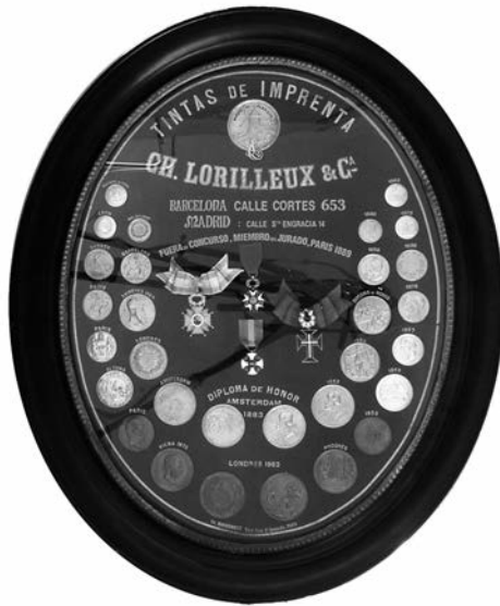
Foto 1. El medaller Lorilleux conservat al Museu de Badalona. Núm. inventari 13387.

tat, passà a dir-se Lorilleux Lefranc Española SA, Coates Lorilleux SA i, després, Sun Chemical SA.