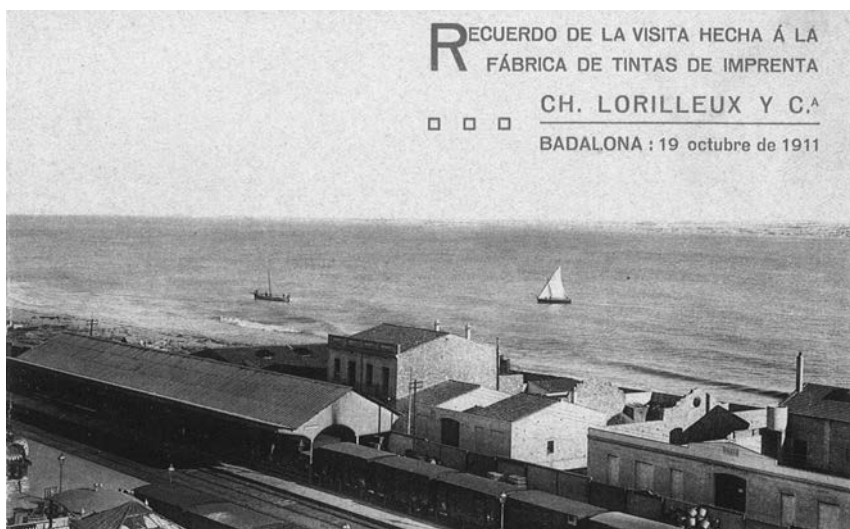
Foto 5. Targeta postal en record de la visita a la fàbrica, l'octubre de 1911, durant la celebració a Barcelona del Primer Congrés Nacional de les Arts del Llibre.