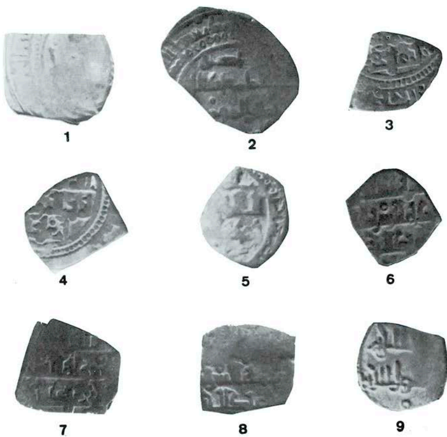
Lámina 3-1, ilegible. 2, Mobaxir. 3 a 8, Abdallah. 9, Mobaxir.