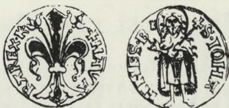
Florín de Carlos II de Navarra (1349-1837) con marca de torre.

La torre , cual marca de ceca, se ve en los florines del Delfinado. 18 Humberto II (1333-1349), último Delfín independiente, vendió sus dominios en 1349 a Carlos de Valois, elevado al trono de Francia como Carlos V quien otorgó aquel título a su hijo mayor. Humberto II acuñó el florín con los tipos comunes; en anverso + HV DPH VIENS, en reverso + S IOHANNES B y la torre como marca, idéntica a la que luego se emplearía en Tortosa; 19 también usó, cual otra marca de taller, un delfín. 20 Carlos V Delfín (1349-1364) grabó las leyendas + KROL DPHS V, en el lado de la flor de lis y + S IOHANNES B, en el de éste con la torre por marca; 21 otra fue el escudete con un palo, écusson au pal . 22