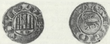
FIG. 5. Dinero de Fernando IV, ceca LO.

Este razonamiento anterior podíamos aplicarlo a Sevilla y Segovia, ya que las dos cecas tienen la misma inicial, y si tenemos Sevilla con «S», a Segovia le aplicamos la segunda letra de su nombre como en el caso anterior y tenemos «SE», pero el problema es que «SE» puede servir para Sevilla y Segovia, este problema desaparecería si en vez de Segovia fuera, por ejemplo, Salamanca, pues siguiendo la norma su marca sería «SA». En definitiva, lo que les sirvió para León y Lorca no era válido para Sevilla y Segovia y de ahí los tres puntos sobre la «S» la cual desapareció y quedaron los tres puntos solos.