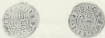
FIG. 6. Dinero similar al de la figura 2.

A última hora quiero agregar una nueva impronta que me remitió monsieur Pierson, de las mismas características que la que originaron estas letras (figura 6) y que está depositada en su monetario en París.