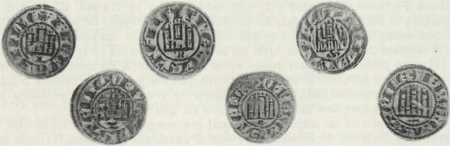
FIG. 4. Varios dineros de Fernando IV (anversos).

Como antes decía, mis argumentos no quieren decir que León no acuñó en Fernando IV, todo lo contrario, y estimo mucho más probable que acuñara y de ser cierto esto, espero que algún día aparezcan estas moneda y con ceca «L». Chaves tenía una ceca desconocida (...) y tenía la ciudad de León que suponía debió de acuñar, uniendo ambas incógnitas le desaparecieron sus problemas.