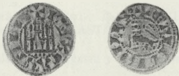
FIG. 1. Dinero de Fernando IV, ceca (...).

Dineros similares se publicaron, pero posiblemente sin tener en cuenta los tres puntos; concretamente Heiss, 1 lámina 5, núm. 6, publica uno con dos puntos a los lados de la «S».