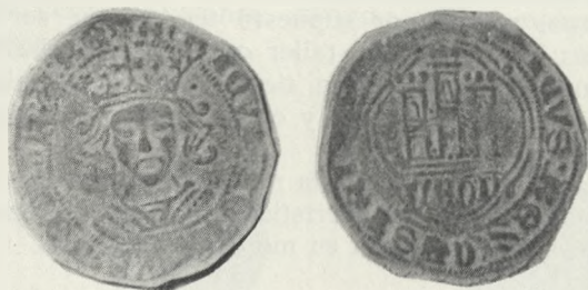
FIG. 7. Cuartillo de Enrique IV, ceca LEON (aumentado de tamaño).

Intenté transmitirles mi opinión respecto a que la ceca tres puntos no la considero leonesa, pero el cuartillo que les quiero mostrar de Enrique IV sí es de León y con todas las letras (figura 7).