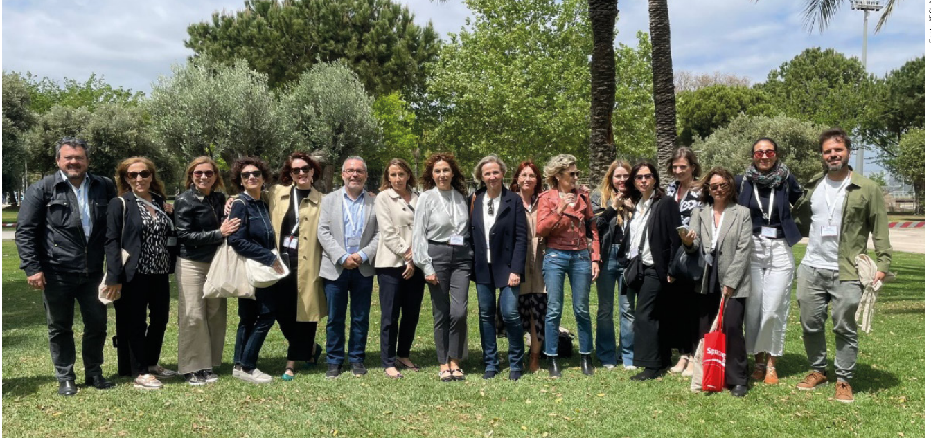
El comitè organitzador d'AESLA 2024 a la mascletà final del congrés

car l'interès dels treballs presentats i la possibilitat que ofereix un congrés com aquest de posar en comú els avantatges i les limitacions que com a lingüistes experimenten sovint en un context tecnològic i social sotmès a evolucions i canvis constants.