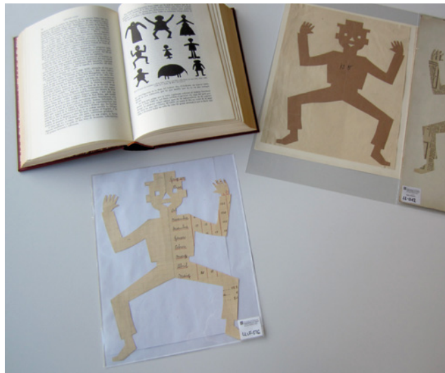
Les Llufes del fons Joan Amades i el Costumari Català

Un quiquer ben enquinqueracolat; qui el desenquinqueracolarà un bon desenquinqueracolar serà; jo el desenquinqueracolaré, perquè sé desenquinqueracolar molt bé.