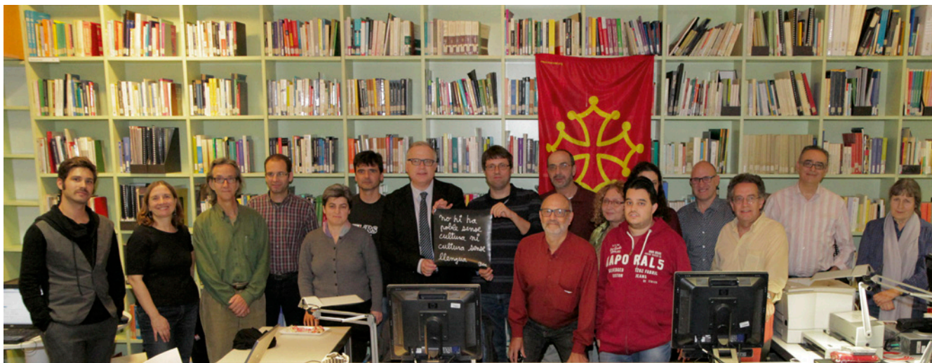
Participants en la III Nuèch de la Lengua dins l'Encastre Digital a Barcelona