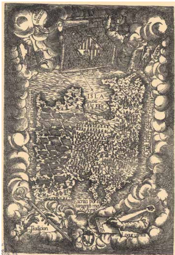
Institut Cartogràfic de Catalunya

Figura 3. El mapa de Vicenç Mut. Com a capçalera de la seva Historia de Mallorca (1659), aquest gravat (amb el SW a dalt) juga amb la cita bíblica “ A fructu frumenti, vini et olei ” per identificar el Migjorn cerealista, el Pla vitícola i la Serra olivarera.