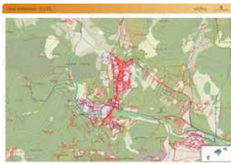
Mapa topogràfic de SITIBSA.

Figura 7. Puigpunyent. A recer del puig de Galatzó que li dona nom, aquesta vila encara mostra el seu aspecte dual amb dos nuclis "vigilats" des del turó de Son Nét: la vila (amb l'església, l'ajuntament i alguna casa) i Son Bru (poble caminer).