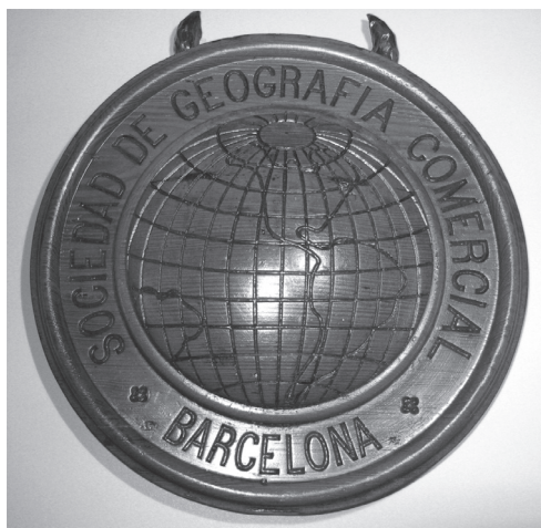
Figura 1. Escut de la Societat de Geografia Comercial de Barcelona