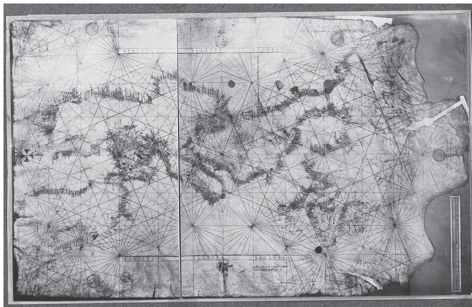
Figura 4. Reproducció fotogràfica del portolà de Guillem Soler, de 1385, que es conserva a l' Archivio di Stato de Florència

L'esdeveniment va tenir una considerable presència als diaris de Barcelona i en altres àmbits de la ciutat. Els participants van ser objecte d'una vetllada d'honor a l'Ajuntament, van poder visitar el Parc Güell i "La Granja Vieja" d'Horta, assistir a una "festa musical catalana" al Palau Municipal de Belles Arts –amb la Banda Municipal, l'Orfeó Gracienc i l'Esbart Folklore de Catalunya– i, l'últim dia, a un sopar a la "Maison Dorée" i una funció de gala