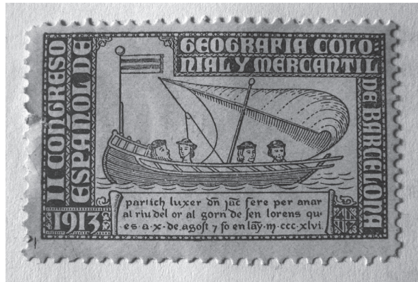
Figura 5. Segell del II Congreso Español de Geografía Colonial y Mercantil