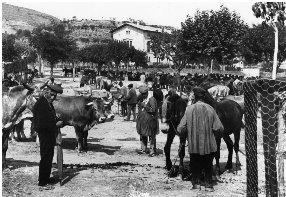
Figura 4. Al Camp del Firal 19

Aquest fet no ha d'estranyar perquè les fires de Solsona eren importants mercats de mules, enmig una àrea de recria que s'estenia de l'altiplà del Solsonès cap a muntanya. Hi havia importants i prestigiosos tractants locals, però també negociants més modestos, que compraven mules sobreanyes (d'1 a 3-4 anys) per fer-les treballar ensems que les ensenyaven –les afaitaven , en la terminologia pagesa–, i quan encara els quedaven dents de llet i se'n podia provar l'edat (3-4 anys), les duïen a vendre a fira (Bertran, 2001, p. 68). Falp deixa clar que hi havia negociants de bestiar, en parlar de la vestimenta: gorres i bruses de fosquejants colors (fig. 4). I que s'hi anava mudat, perquè feia festa: la gent duïa roba virolada i la canalla anaven vestits com els grans.