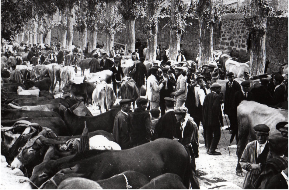
Figura 3. La fira al vall del Travesset 17

I, és clar, la mercaderia de la fira és, sobretot, el bestiar: les cabres i les ovelles a la ribera; munió de mules, cavalls i eugues, bous i vaques arrengrerades al vall del Travesset i al firal del Camp; els porcells, l'aviram i els ous, a la plaça perquè en aquesta diada també s'hi fa mercat. Hom hi troba fruita, plats i olles, teles i algun volant. Hi ha parades d'esmolets i homes que venen i adoben paraigües; xarlatans que anuncien els increïbles avantatges de llur mercaderia i el seu preu, també increïble; saltimbanquis que fan captada i gitanes que canten i ofereixen quincalla, mentre els seus homes cerquen ases a bon preu. A la veïna plaça de Sant Joan, venen blat, trumfes i llegum, i, al cóm de la font, hi beuen els bous i els animals de sella, perquè al darrere el manescal no para de ferrar animals. Al firal del camp, baix l'arbreda dels Caputxins , 18 es disposen taulats on s'ofereix menjar, conill i moltó a la graella, sang i fetge fregits, i porró de mistela.