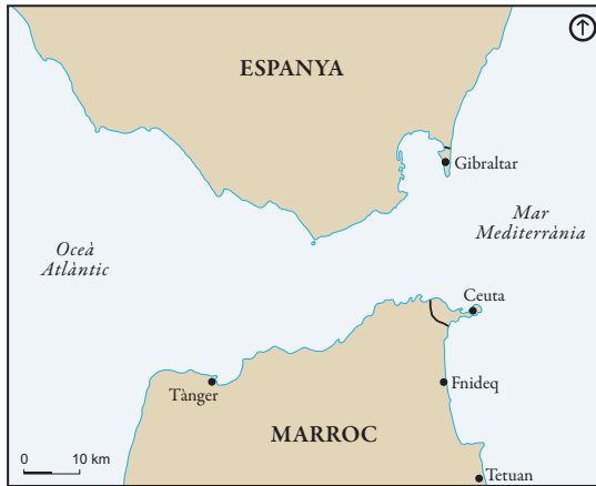
Figura 1. Estret de Gibraltar

perfil de la regió fronterera varia depenent de com es conceptualitzi i demarqui el hinterland (o “rerepaís”) de Ceuta. Si bé l'àrea d'influència de Ceuta podria circumscriure's a la ciutat marroquina de Fnideq (46 km 2 ), el ressò de la frontera abasta, com a mínim, el conjunt de la regió de Tànger-Tetuan (11.570 km 2 ). En qualsevol cas, en aquest treball, Fnideq és conceptualitzat com l'epicentre del vessant marroquí de la regió fronterera.