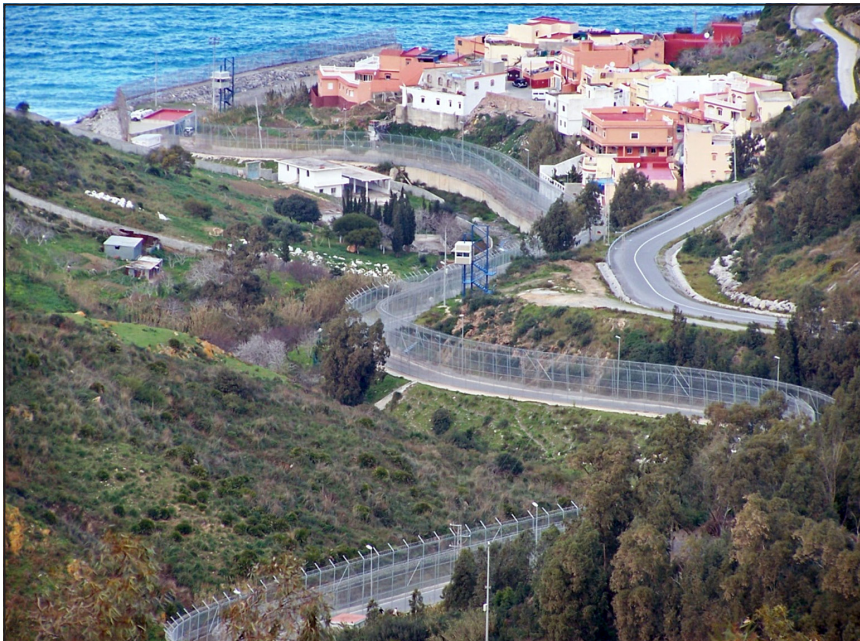
Figura 3. El perímetre Ceuta-Marroc

costes de la península Ibèrica (European Commission, 2005). En conseqüència, la pressió migratòria a les fronteres de Ceuta i Melilla va augmentar de manera remarcable. La tardor del 2005 es van multiplicar les entrades irregulars a través del perímetre. Centenars d'immigrants van poder creuar la frontera a través de les tanques, però molts més no ho van aconseguir. El 29 de setembre de 2005 van morir 5 immigrants que provaven de creuar irregularment la frontera de Ceuta (Van Houtum i Ferrer-Gallardo, 2010). Els successos de la tardor de 2005 van precedir el reforçament de la tanca i la intensificació dels controls fronterers, tant per part espanyola com per part marroquina (Blanchard i Wender, 2007; Ferrer-Gallardo, 2007). A partir d'aleshores, el nombre d'entrades irregulars es va reduir. Tanmateix, se'n van seguir produint: 339 l'any 2009, 561 el 2010 i 1.402 el 2012. 9 El cas de Sambo Sadiako, un senegalès de 30 anys, il·lustra la persistència d'episodis tràgics a l'entorn del perímetre de Ceuta. En Sambo va provar de creuar la frontera el 7 de març de 2009 però no ho va aconseguir. El seu cos es va quedar atrapat a la tanca metàl·lica. Es va fer una ferida al braç amb el material tallant de la tanca i es va dessagnar fins a la mort. 10