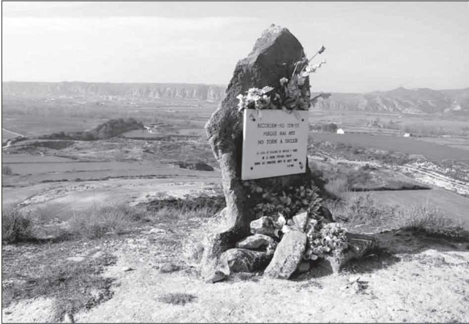
Monòlit erigit per la lleva del biberó en recordança dels morts a l'ofensiva del Merengue. Al fons la ribera del Segre en direcció a Balaguer.

ment a un poblat ibèric, compta amb unes monumentals trinxeres, construïdes amb parets de ciment mitjançant un encofrat fet amb taulons a la cara interior i sacs terrers a l'exterior. L'encarament del conjunt cap a l'oest suscità la discussió sobre l'adscripció del conjunt a un o altre exèrcit; tanmateix les dades disponibles assenyalen la pertinença de la posició als franquistes: cal pensar que els permetia controlar el possible avenç dels republicans per la plana immediata del nord (Santa Quitèria) i que formava part d'un conjunt construït al voltant del tossal.