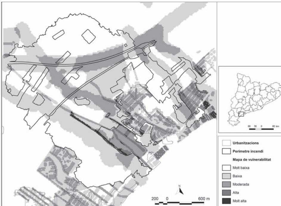
Figura 3 Mapa de vulnerabilitat dels assentaments

La combinació de les capes mitjançant el SIG ha permès obtenir el mapa del Grau de vulnerabilitat dels assentaments de Miami Platja en sis categories (Figura 3), per tal de donar resposta a l'objectiu pretès en aquest estudi. En aquest mapa s'hi incorpora el perímetre de l'incendi, fet que permet posar en relació la vulnerabilitat dels assentaments amb les àrees que foren afectades per l'incendi del 4 de juliol.