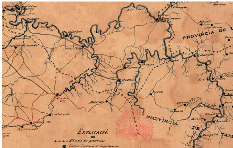
Figura 2: Tram baix del Riu Ebre.

Atenent al contingut del mapa la possibilitat de l'autor d'emprar cartografia existent era factible per les zones representades de les províncies de Sòria, Saragossa i Tarragona, prenent com a base els mapes provincials de F. Coello a Escala 1:200 000 ja publicats, per la part de Lleida tenia al seu abast la còpia fotogràfica de la minuta del que havia de ser el mapa provincial de Lleida a Escala 1:200 000 de F. Coello. 16 Per les províncies de Guadajajara y Teruel no es va publicar en mapa a Escala 1:200 000, però per la zona de Guadalaajara podia utilitzar el mapa que bastí l'any 1879 José Reinoso : Província de Guadalaajara a escala 1:400 000, tanmateix el detall de la hidrografia i dels camins és menor; per Teruel també hauria pogut emprar el mapa de F. Colello, gravat per J. Reinoso a escala 1:400 000 de l'any 1868. Tot plegat només és una possibilitat no constatada.