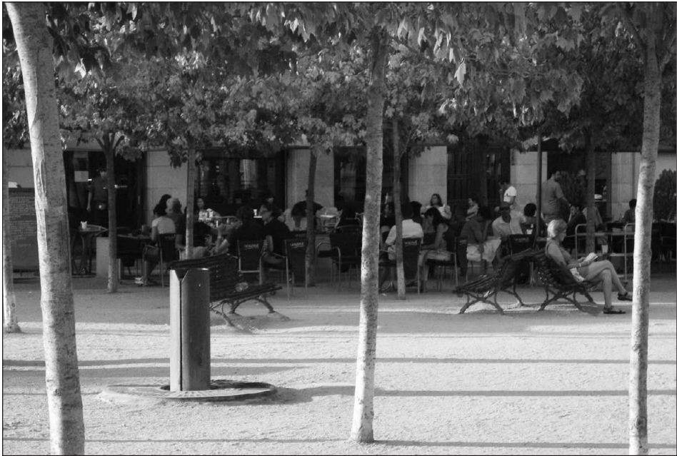
Figura 3 Plaça de Santa Susanna

les crítiques que va merèixer a nivell de premsa local, es pot afirmar sense cap dubte que els usuaris de l'espai i els residents del barri van assumir aquesta transformació i la van arribar a valorar molt positivament al llarg del temps.