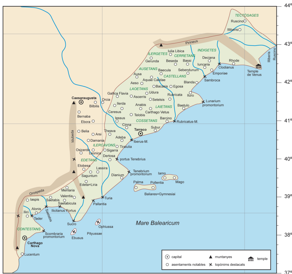
Figura 3. Els Països Catalans segons la cartografia restaurada de C. Ptolemeu, d'acord amb Stückelberger-Grasshoff (2006) modificat

La línia delimita l'àrea estudiada per l'autor.