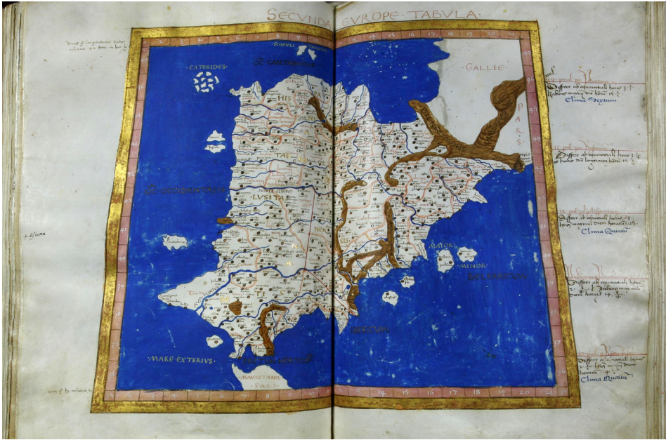
Figura 2. Hispania al Codex Valentinus de la Cosmographia de Claudi Ptolemeu en versió llatina de J. d'Angeli, segons Fischer (1932), interposada entre l'L-15 i l'L-16.

Biblioteca Universitària de València, m.s. 1895