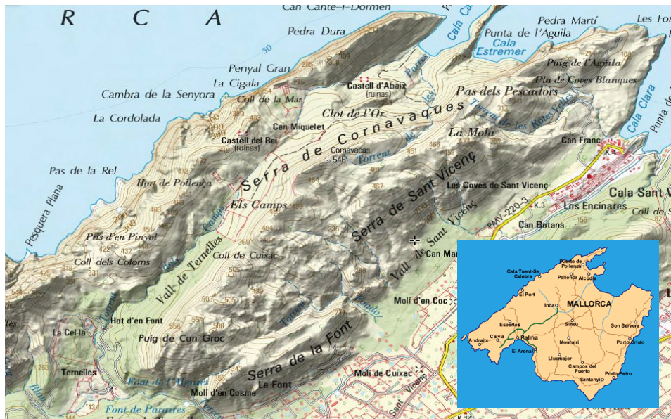
Figura 2. Mapa de l'àrea d'estudi de la vall de Ternelles dins la serra de Tramuntana entre els municipis de Pollença i Escorca