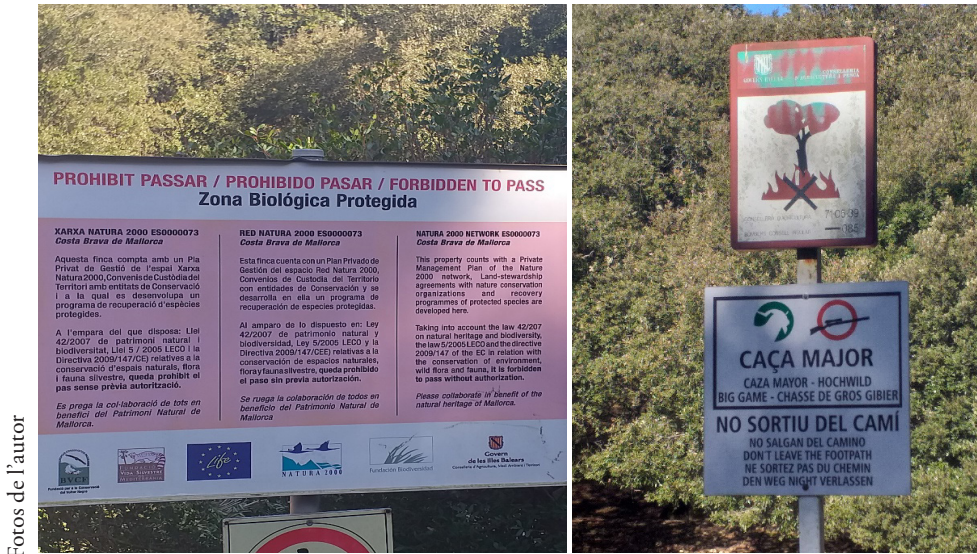
Figura 3. Una reserva segregada

Més enllà de la lògica, els diversos casos citats permeten entendre com la natura no és més que l'aplicació d'un criteri humà exclusiu per damunt la resta d'usos, sota un precepte pres com a veritat única. La natura entesa des d'aquesta lògica esdevé en certa mesura, com han estat els preceptes religiosos damunt l'espai, en l'establiment per exemple d'espais sagrats tabú, amb la diferència que en el segon cas, tothom ho entenia com un precepte diví però establert pels homes, mentre que en el primer cas, la natura revesteix un caràcter determinista.