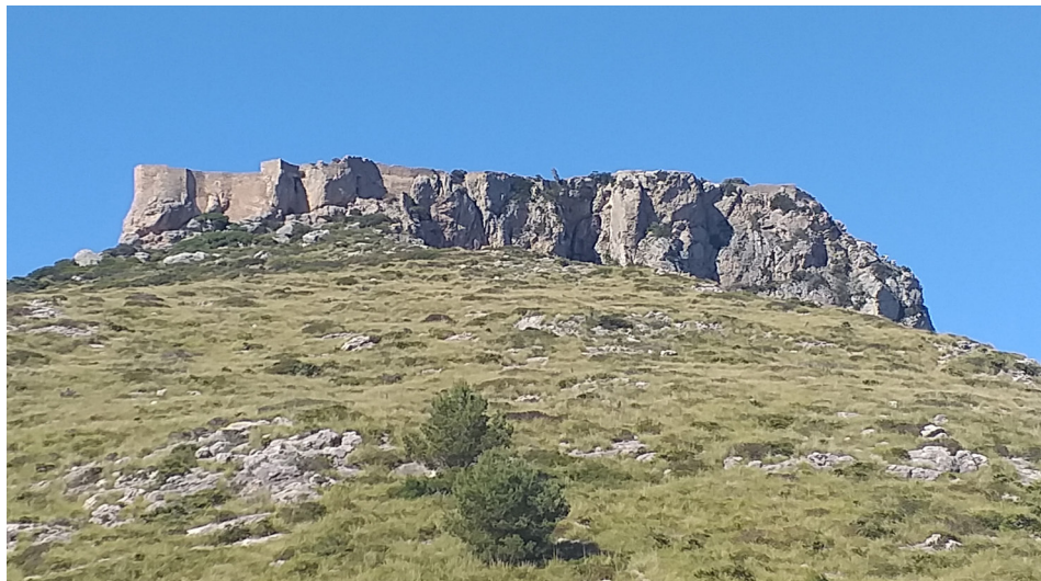
Figura 4. El castell de Pollença, zona de nidificació de voltors