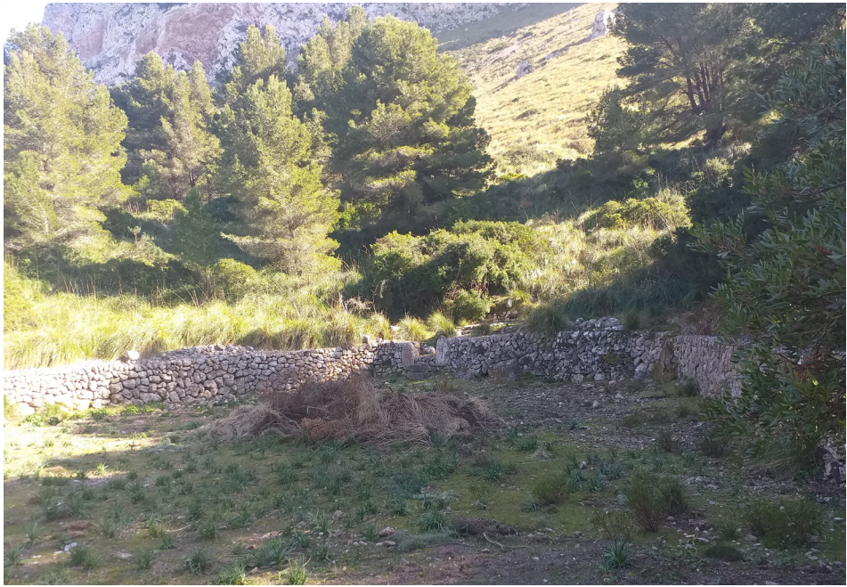
Figura 5. Coll Miquelet

talment desbrossat i part dels murs es troben en total d'abandó. Alhora també el Castell del Rei, tot i la seva rellevància comença a patir el mateix procés de degradació per culpa de la restricció d'accés però sobretot per la prioritització de la nidificació sobre l'interès cultural, malgrat les protestes creixents davant les administracions.