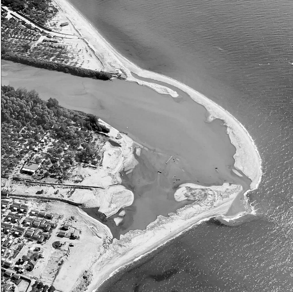
Figura 2. Creixement de la desembocadura al delta de la Tordera. S'aprecia com la formació d'una barra litoral genera una llacuna que, momentàniament, arribarà a estar pràcticament separada de mar obert.