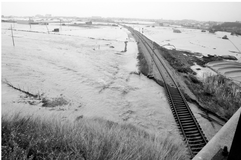
Fig. 3. La zona agrícola del Pla de Grau inundada (delta de la Tordera, Malgrat de Mar), vista des del pont de la carretera BV-6001 vers l'oest. S'aprecia el descalçament del talús ferroviari de la línia R1 amb uns rails que han perdut tot el balast.

Font: Agència Catalana de Notícies, 21/01/2020